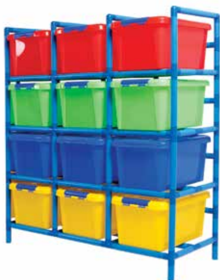
581 120 Estantería tubular con cajoneras 4 x 3. Tube rack with plastic drawers 4 x 3.