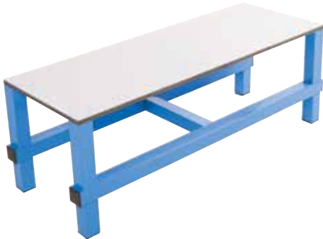
661 110 Banco simple de tubo con asiento fenólico de 100 x 40 x 46 cm. Tubo de alta resistencia. Simple tube bench with fenolic seat. Section 100 x 40 x 46 cm. High resistance tube.