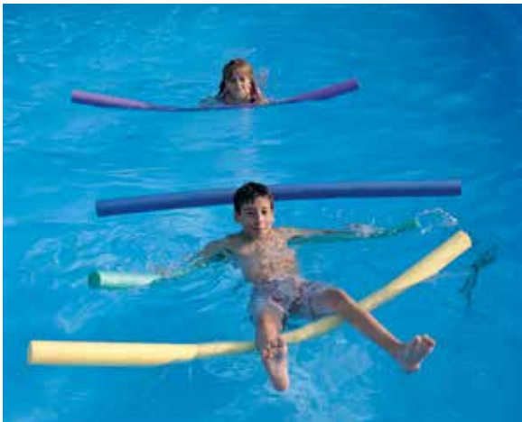
660 915 Barra flotante, Ø 65 mm., longitud 1,50 m. Floating bars Ø 65 mm. length. 1,50 m.