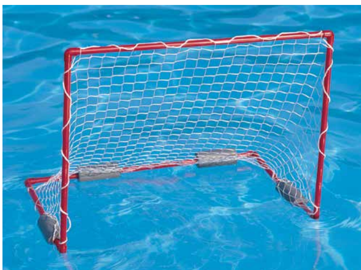
660 902 Portería waterpolo flotante, 90 x 70 x 60 cm. Floating waterpolo goal, 90 x 70 x 60 cm.