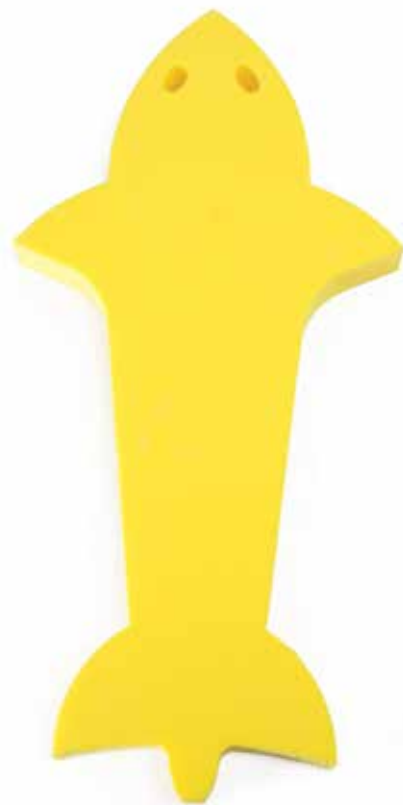
660 930 Tiburón. Medidas: 66 x 50 cm. Shark. Measure: 66 x 50 cm.