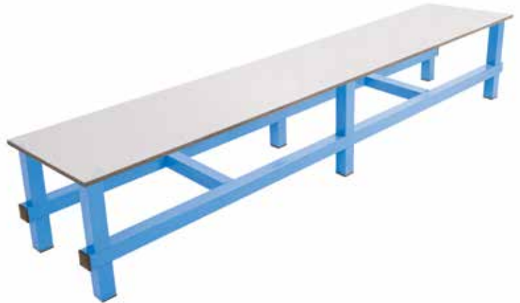
661 115 Banco simple de tubo con asiento fenólico de 200 x 40 x 46 cm. Tubo de alta resistencia. Simple tube bench with fenolic seat. Section 200 x 40 x 46 cm. High resistance tube.