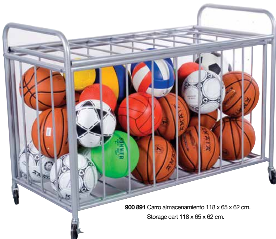
900 891 Carro almacenamiento 118 x 65 x 62 cm. Storage cart 118 x 65 x 62 cm.