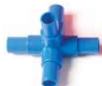
901 005 Esquina 5 salidas para estantería con cajoneras. Corner piece with 5 exits for tube rack with plastic drawers.