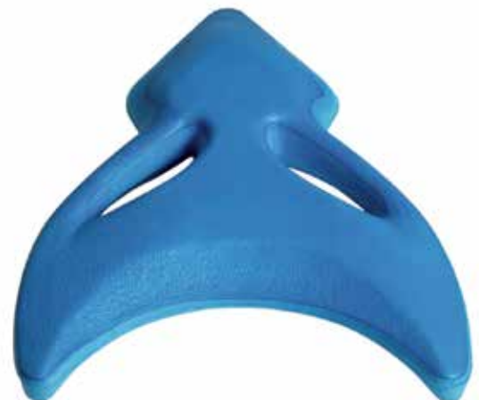
660 918 Tabla de natación Speed. - Speed swimming board.