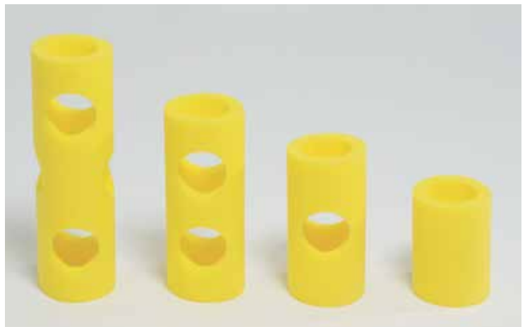
660 911 Conectores. - Connectors Ø 100 x 140 mm.