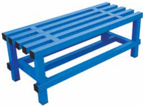
661 100 Banco simple con tubo de 100 x 40 x 48 cm. Tubo de alta resistencia. Simple tube bench Section 100 x 40 x 48 cm. High resistance tube.