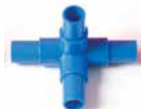
901 004 Esquina 4 salidas para estantería con cajoneras. Corner piece with 4 exits for tube rack with plastic drawers.