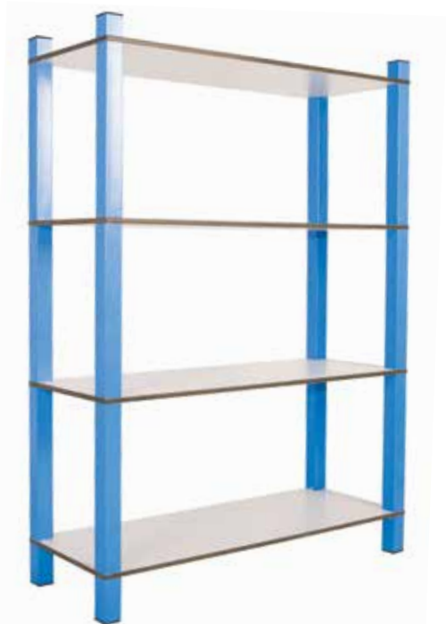
661 161 Estantería de tubo con baldas de DM lacado de 100 x 36 x 148 cm. Tube rack made of lacred DM selves and 100 x 36 x 148 cm.