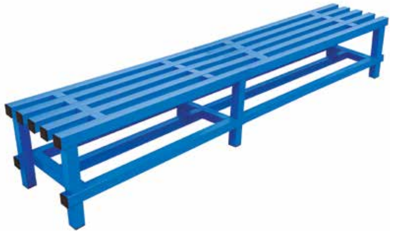
661 105 Banco simple de tubo de 200 x 40 x 48 cm. Tubo de alta resistencia. Simple tube bench Section 200 x 40 x 48 cm. High resistance tube.