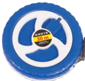
900 861 Cinta métrica 30 m. Metric tape 30 m.