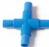
901 002 Cruz para estantería con cajoneras. Cross piece for tube rack with plastic drawers.