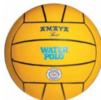
700 225 Balón waterpolo caucho celular. Lámina de caucho en una única pieza. Peso: 365 a 385 gr. Ø 219 - 225 mm. Recomendado para entrenamiento y competición. Waterpolo cellular rubber ball. Weight: 365 to 385 gr. Ø 219 - 225 mm. Suitable for training and competition.