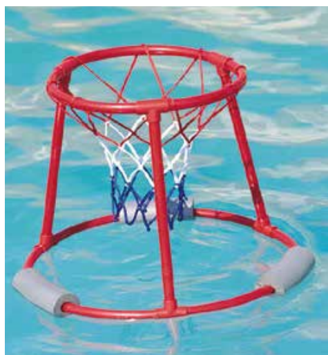
660 904 Cesta de basket flotante, Ø 52 cm., altura 40 cm. Floating basket, Ø 52 cm., height 40 cm.