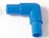
901 000 Codo para estantería con cajoneras. Elbow piece for tube rack with plastic drawers.