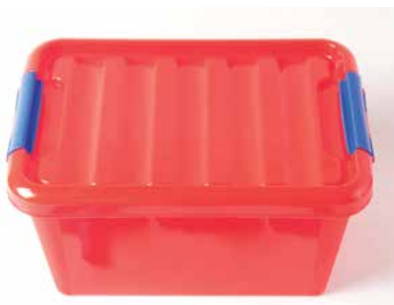
901 006 Cajón para estantería con cajoneras. Medidas- 29x42x20 cm. Drawer for tube rack with plastic drawers. Measure: 29x42x20 cm.