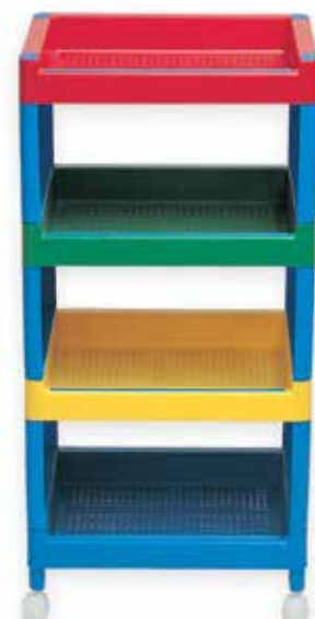
439 918 Carrito con bandejas. - Trolley with trays.