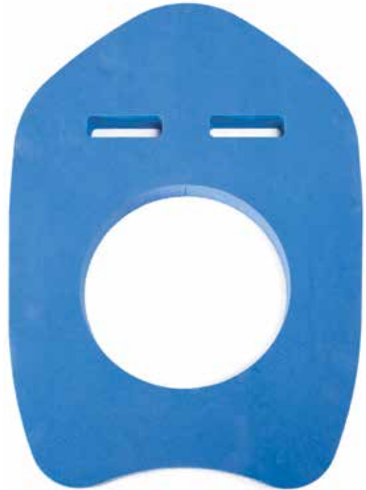
660 932 Lancha. Medidas: 66 x 50 cm. agujero de 24 cm. Launch. Measure: 66 x 50 cm. Hole Ø 24 cm.