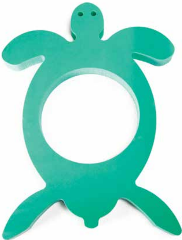
660 933 Tortuga. Medidas: 66 x 50 cm. agujero de 24 cm. Tourtle. Measure: 66 x 50 cm. Hole Ø 24 cm.