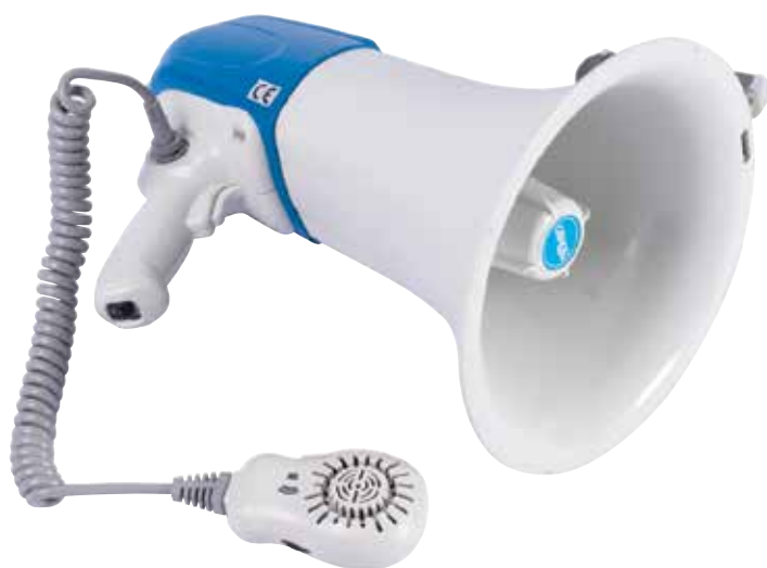
900 870 Megáfono. Potencia 25 W. No incluye baterías. Megaphone. Power 25 W. No batteries included.