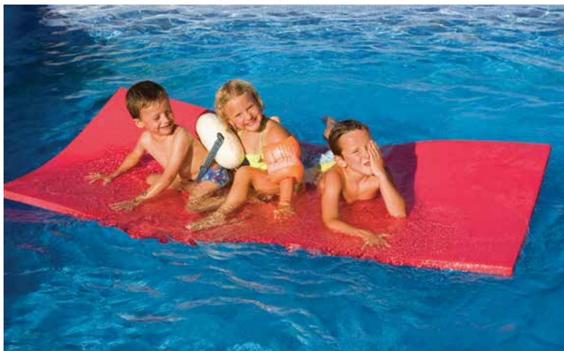
660 950 Tapiz rectangular de 200 x 100 x 3 cm. - Water carpet 200 x 100 x 3 cm.