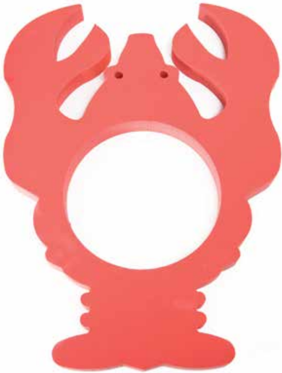
660 931 Cangrejo. Medidas: 66 x 50 cm. agujero de 24 cm. Crab. Measure: 66 x 50 cm. Hole Ø 24 cm.