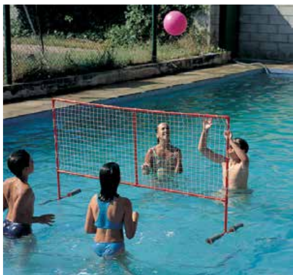
660 903 Red de voley flotante, 186 x 100 cm. Floating volley net, 186 x 100cm.