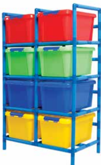
581 125 Estantería tubular con cajoneras 4 x 2. Tube rack with plastic drawers 4 x 2.