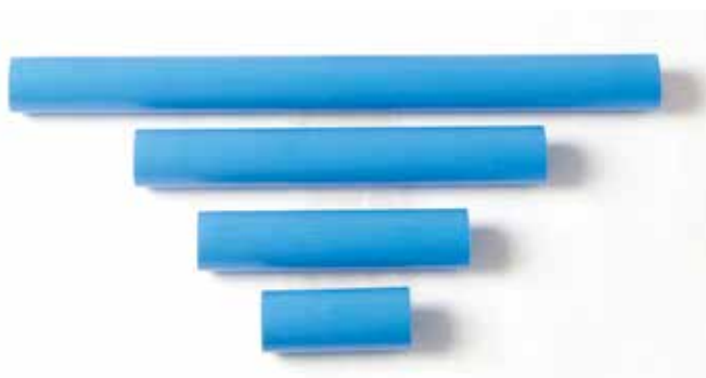
901 007 Tubo alto impacto para estantería. High impact tube for rack with plastic drawers.