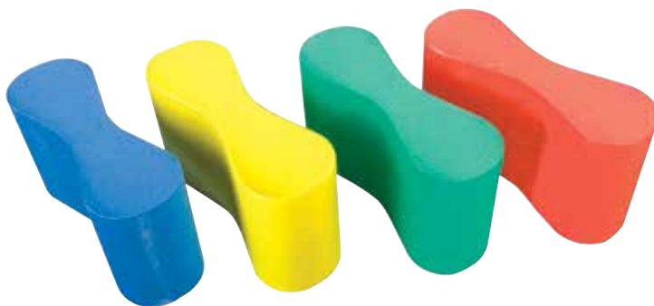
660 970 Pullboy.