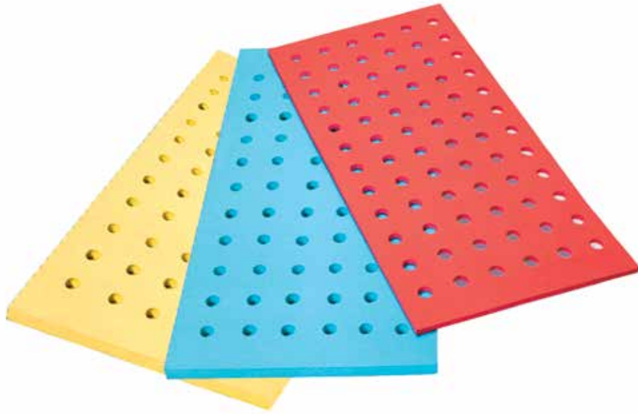
660 953 Tapiz rectangular con agujeros. De 100 x 66 x 2 cm. - Water carpet with holes 100 x 66 x 2 cm.