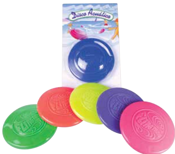
650 200 Disco acuático. - Water disk.