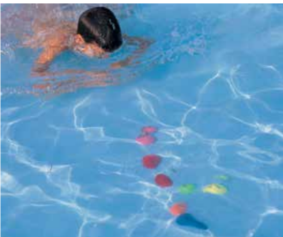
660 916 Perlas de buceo Ø 70 mm. - Underwater pearls Ø 70 mm.