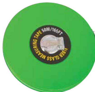
900 862 Cinta métrica 50 m. Metric tape 50 m.