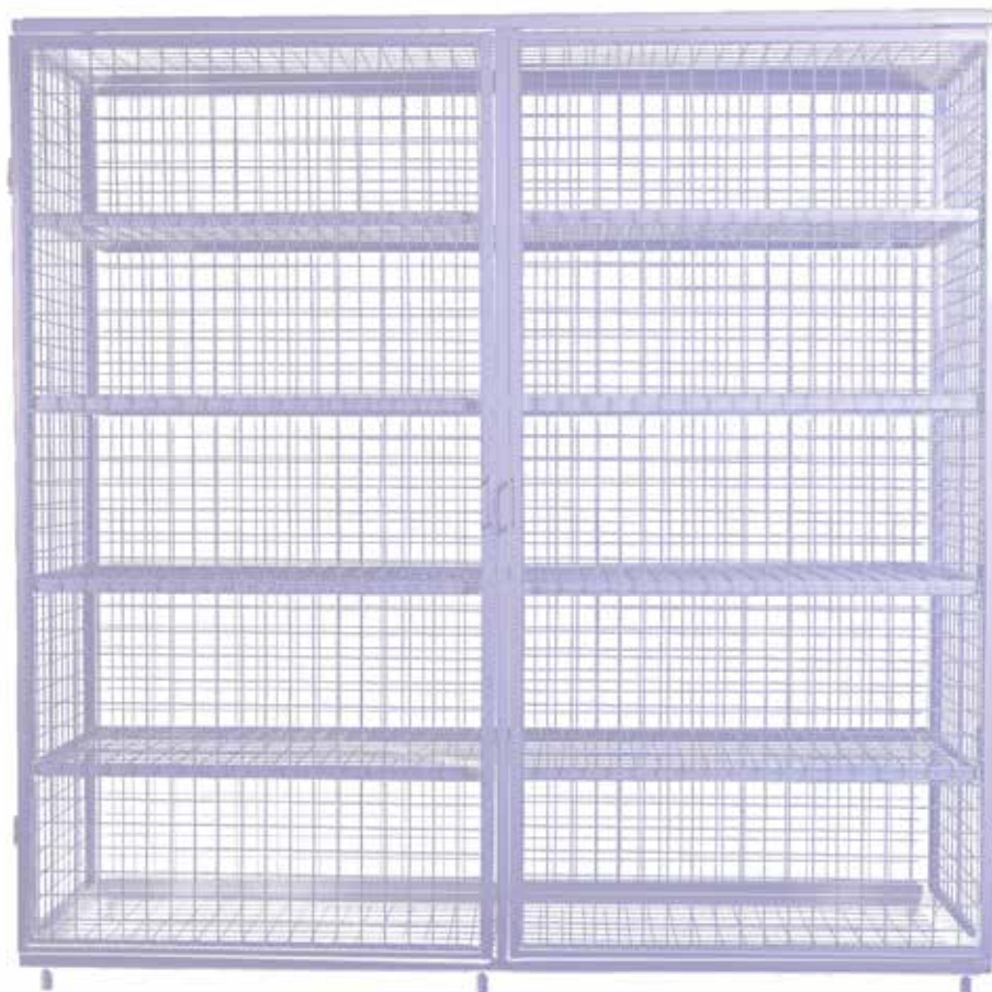
900897 Estantería metálica 2000 x 2000 x 600 mm.

Fabricado con armazón de acero estirado en frío de dimensiones 20 x 20 x 1,5mm. Malla soldada de 50 x 50 con un espesor de 5mm. Todo el armario tratado contra la corrosión. Medidas de 2000 x 2000 x 600 mm. Dispone de 4 estantes metálicos regulables en altura. Sostenido por 6 patas cubiertas de goma de 10 cm, que evitan el deterioro del pavimento. Sistema de apertura de doble puerta con bisagras soldadas al armazón, para facilitar la entrada y recogida de material. Sistema de cierre por candado.