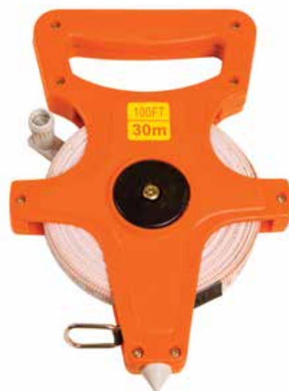
900 863 Cinta métrica 30 m. Metric tape 30 m.