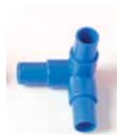
901 003 Esquina 3 salidas para estantería con cajoneras. Corner piece with 3 exits for tube rack with plastic drawers.