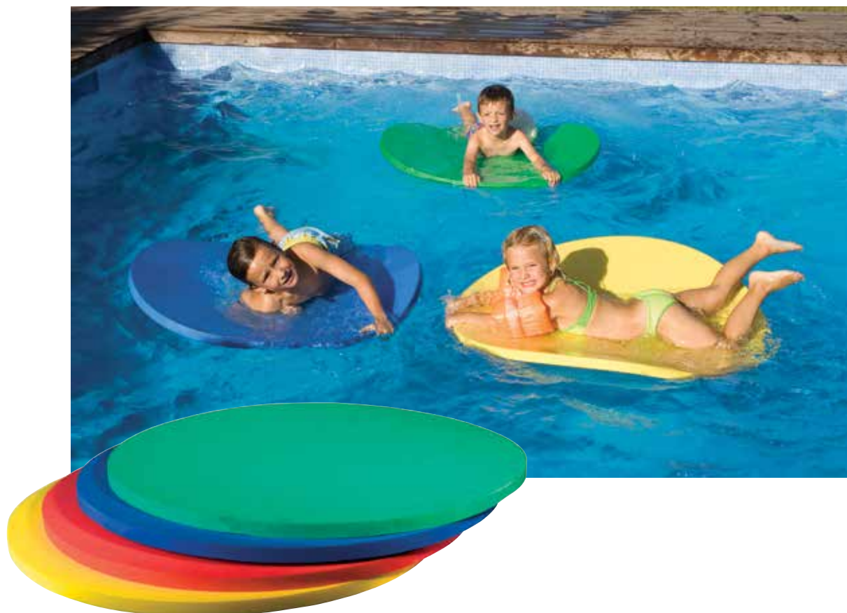
660 960 Tapiz circular Ø 1 metro x 4,2 cm. - Round water carpet Ø 1 m x 4,2 cm.