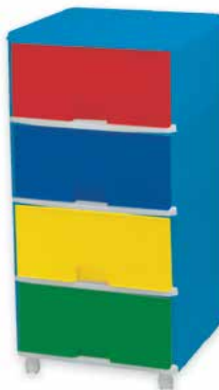
439 917 Carrito con cajones. - Trolley with drawers.