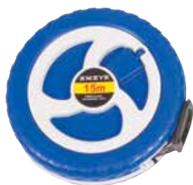
900 860 Cinta métrica 15 m. Metric tape 15 m.