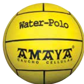
700 226 Balón mini-waterpolo caucho celular. Lámina de caucho en una única pieza. Mini-waterpolo cellular rubber ball. Non slipping surface.