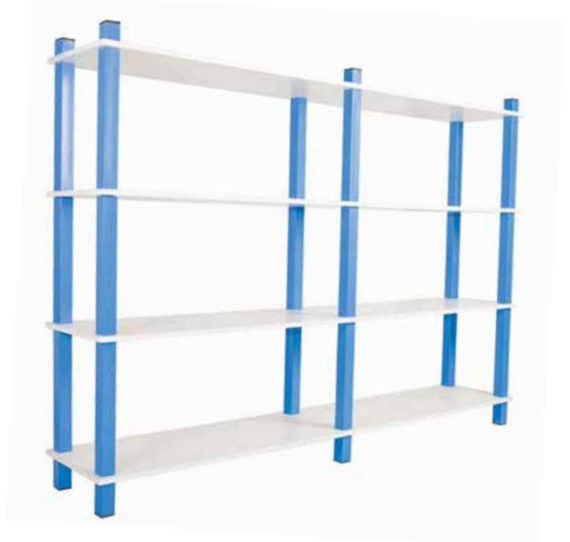
661 160 Estantería de tubo con baldas de DM lacado de 200 x 36 x 148 cm. Tube rack made of lacred DM selves and 200 x 36 x 148 cm.